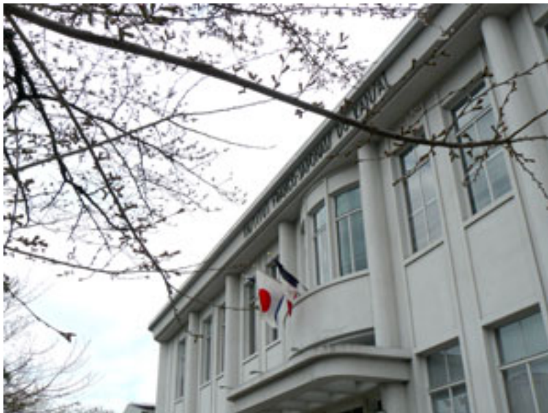
Institute francais du Japon – Kansai (原关西日法学馆・注册有形文化遗产)