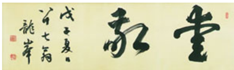
创始人稻畑胜太郎所书“爱·敬”（龙峯为胜太郎的雅号）