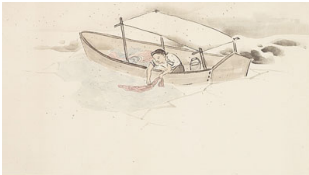
神坂雪佳所绘《在冬天的罗讷河上洗丝线》