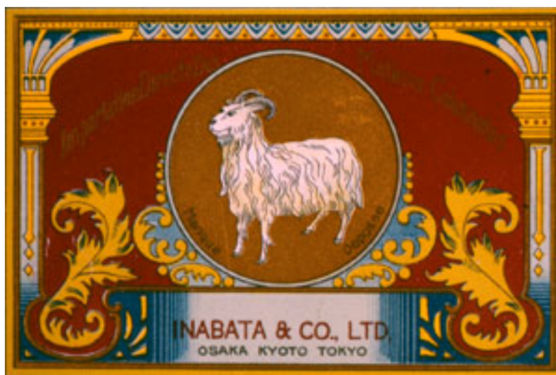
稻畑商店的商标（日本染料公司的产品分包时使用）